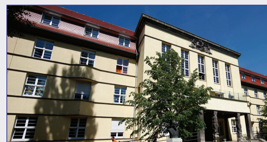
Haus 3 - Frau-Mutter-Kindzentrum