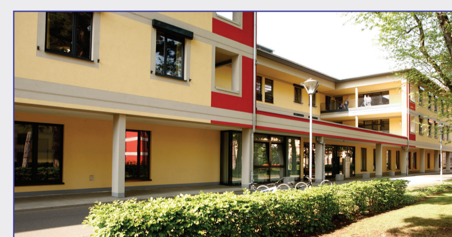
Haus 13 - Zentrum für Geriatrie