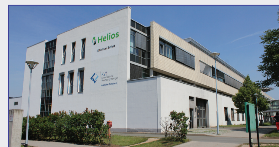
Haus 1 - Hauptgebäude mit Haupteingang - Rezeption/Aufnahme - Cafeteria - Geldautomat - Einkaufsmöglichkeit