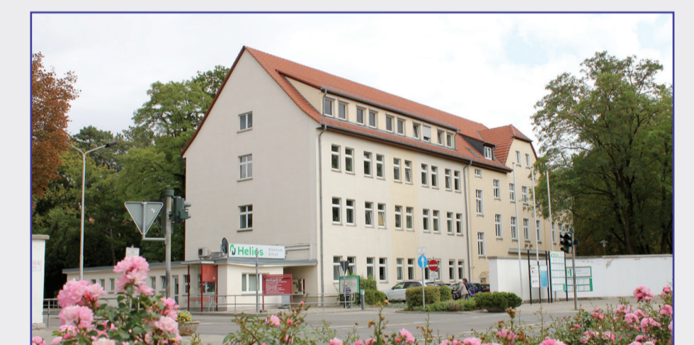
Haus 11 - Hauptpforte und Verwaltung / Klinikgeschäftsführung