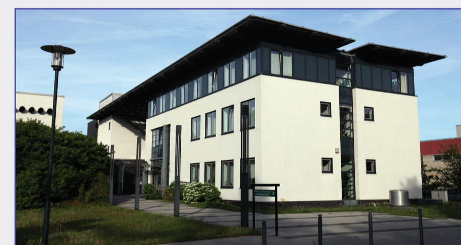
Haus 4 - Strahlenklinik