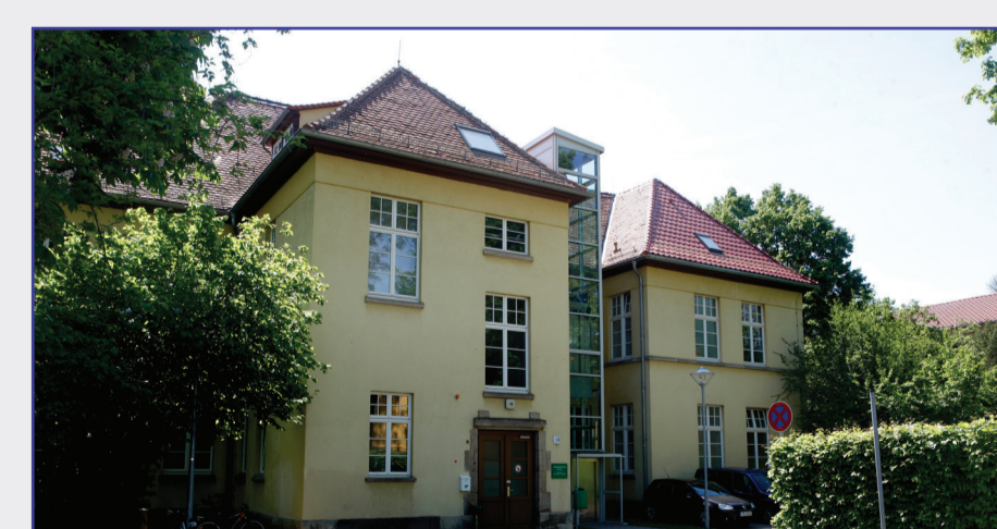
Haus 19 - Sozialpädiatrisches Zentrum