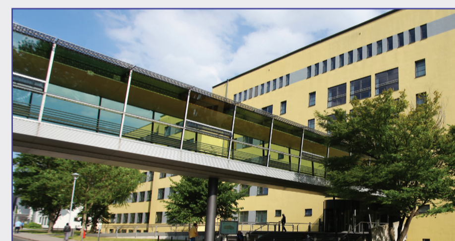
Haus 2 - Gebäude für Innere Medizin und Hautkrankheiten mit Auditorium (EG)