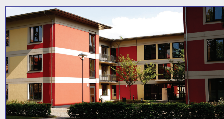
Haus 15 - Psychiatrie, Psychotherapie und Psychosomatik