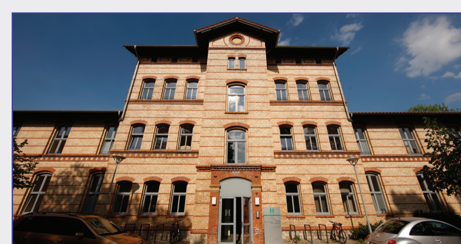
Haus 14 - Kinder- und Jugendpsychiatrie, Psychotherapie und Psychosomatik