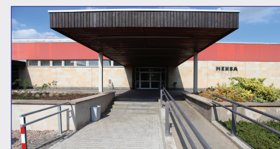
Haus 5 - Mensa